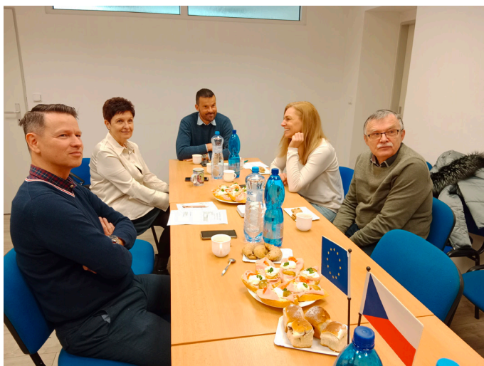
Školení zaměstnanců členů klastru v měkkých manažerských dovednostech

BC LOGISTICS s. r. o. – měkké a manažerské dovednosti HOBES spol. s r. o. – měkké a manažerské dovednosti STATIKA DESIGN – měkké a manažerské dovednosti NAM system, a. s. – jazykové vzdělávání NetDirect s. r. o. – měkké a manažerské dovednosti RESPOND & Co, s. r. o. - měkké a manažerské dovednosti Projekt byl ukončen 31. 5. 2023.